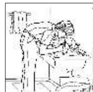
Lavar las manos